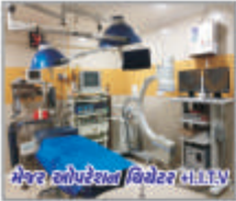
મેટર ઓપરેશન થિયેટર માટે I.I.T.V