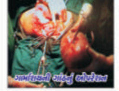
ગર્ભાશયની ગાંઠનું ઓપરેશન