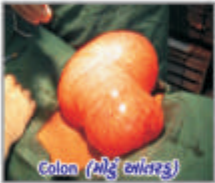
Colon (મોડું બાંધરૂ)