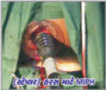
(સ્ટેપલર) હરસ માટે MIPH