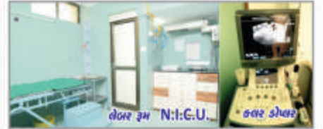
લેબર રૂમ N:I:C.U.