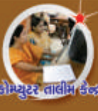
કોમ્પ્યુટર તાલીમ કેન્દ્ર